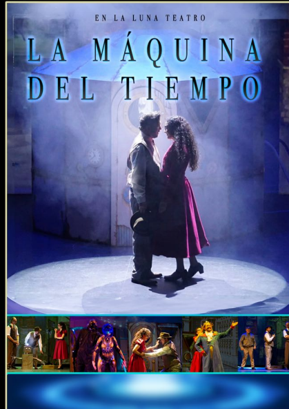
La Máquina del Tiempo Musical-Familiar