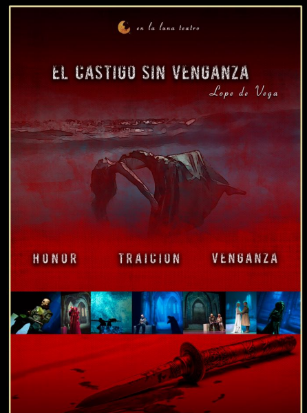
El Castigo sin Venganza Teatro Clásico siglo de Oro