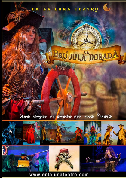
La Brújula Dorada Musical-Familiar