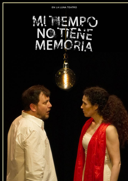
Mi Tiempo no tiene Memoria Teatro y Género (Adulto)